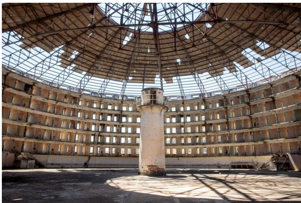
Abb. 2: Innenansicht des Panopticons im ehemaligen Presidio Modelo, Kuba

Für Foucault sind es Institutionen wie das Gefängnis oder die Psychiatrie, die durch permanente Überwachung einen unsichtbaren Zwang erzeugen, der auf die Psyche der Individuen abzielt. 22 Sie „produzieren“ dadurch ein nützliches Individuum, das sich nicht gegen die Machtstrukturen erhebt und keine revolutionären Gedanken aufkommen lässt.