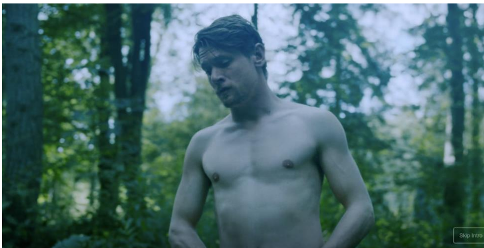
Abb. 4: Screenshot aus Lady Chatterleys Liebhaber : 01:05:05

Lioba Schlösser schreibt in Macht und Repräsentation „dass sowohl Mise-en-scène als auch filmischer Blick als Instrumente des Widerstands gegen normative Strukturen fungieren können“. 28 Es kann also in Anlehnung an Schlösser behauptet werden, dass hier ein weiblicher Blick etabliert und Widerstand gegen gängige Darstellungskonventionen instrumentalisiert wird. Die Frauenfigur kann hier offen und freimütig ihre Lust zum Ausdruck bringen, wird nicht verurteilt und agiert auf Augenhöhe mit der Männerfigur. Die sehr bewegliche und lebendige Handkamera folgt den Gesichtern und Körpern von der liegenden Stellung zum aufrechten Sitz.