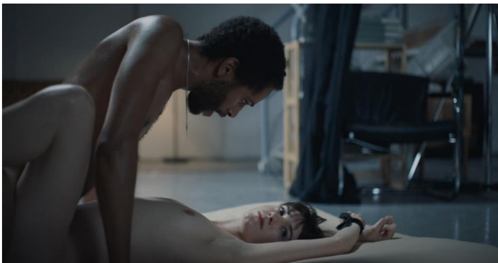
Abb. 2: Screenshot aus Normal People : 00:05:58

Kontradiktorisch hierzu wird der Eindruck von Distanz verfestigt durch die Halbtotale, die den sadomasochistischen Sex von Marianne mit Lukas präsentiert. Durch den eindringlichen Blick der langsamen Kamerafahrt wird eingefangen, wie die liegende, gefesselte Marianne Lukas, der sie unsanft, aber rhythmisch penetriert, mit leerem Blick ansieht und dann ihr Gesicht zur Seite dreht (siehe Abb. 2). Die sterile Umgebung des Raums, der als sein Fotostudio erkennbar ist, wird von den Metall-Füßen der Stative im Hintergrund unterstrichen. Der Charakter des Lichts in dieser Einstellung ist hart, kühl und bläulich beschaffen und wird metallisch von Lukas Rückenmuskulatur gespiegelt. Den beiden Räumen ist ihre minimalistische Ausstattung gemein. Während in Connells Studentenzimmer ein Eindruck von